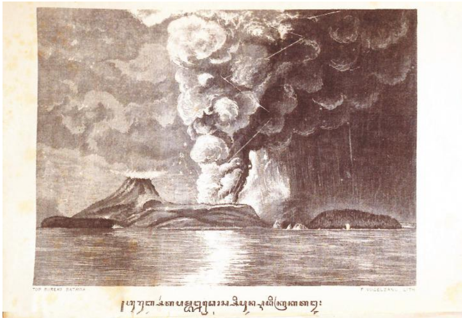
Afb. 8 Urub sarta pambledhosipun redi Krakatau [Het ontvlammen en ontploffen van de berg Krakatau], uit: F.L. Winter en R.M.T Purwa Negara, Urubipun redi Krakatau . (Surakarta: Vogel van der Heijde en Co, 1884)

lampahipun Purwalelana ( De reizen van Purwalelana ), die in 1865-1866 verscheen en geschreven werd door de regent van Kudus. 134 Winters werk past binnen de toenemende interesse onder priyayi's voor reisliteratuur en praktische handboeken aangaande geografie en topografie waarbij proza de norm werd. In de loop van de negentiende eeuw kregen de priyayi's een steeds belangrijker rol binnen het koloniale regime en zij identificeerden zich meer en meer met het Europese gedachtegoed. De islam bleef een belangrijk deel van hun identiteit, maar de kloof groeide met groepen in de samenleving die zich steeds meer richtten op reformgezinde islamitische stromingen. Dit vertaalde zich in onderwijs waarin een deel van de Javanezen kinderen geletterd werd in Javaans schrift en een deel in Arabisch schrift. 135