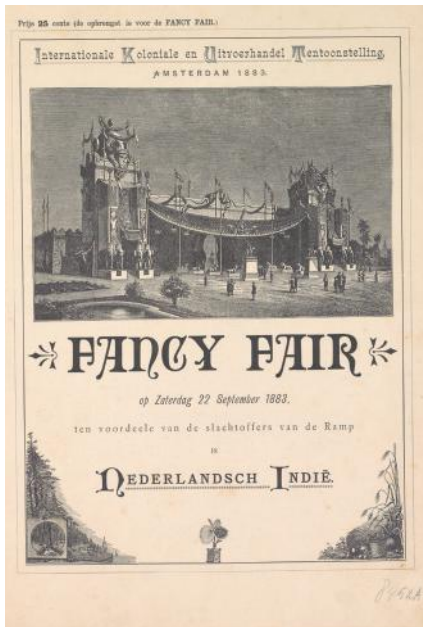
Afb. 3 Aankondiging voor de Fancy Fair op 22 september 1883 te Amsterdam.

tegen wie Max Havelaar strijd voerde vanwege zijn uitbuiting van de Javanen, op de dag van de uitbarsting een familiefeest vierden, waar zij door een vloedgolf van de aarde werden weggevaagd. 38