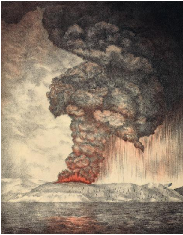
Afb. 1 De uitbarsting van de Krakatau in 1883, uit: G.J. Symons e.a. (ed.), The eruption of Krakatoa, and subsequent phenomena. Report of the Krakatoa Committee of the Royal Society . London: Trubner & Compagny, 1888.

vuurtorenwachter in Anyer? Hij bleef op zijn plaats en zag hoe zijn vrouw en kinderen voor zijn ogen verdronken. Zelf overleefde hij de ramp op het nippertje, nadat de vuurtoren instortte toen die door een rotsblok was geraakt. Van de vuurtoren rest, tot op de dag van vandaag, slechts het fundament. In 1885 werd er een nieuwe gebouwd, een geschenk van Willem III, die er nog steeds staat. 8 Fascinerend is ook het verhaal van het Nederlandse oorlogsschip, de Berouw , dat in de haven van Teluk Betung lag, en door een vloedgolf vierhonderd meter verder op het strand werd gesmeten. De bemanning liet daarbij het leven. Een nieuwe golf slingerde het schip nog drie kilometer verder landinwaarts, waar het vervolgens nog tientallen jaren bleef liggen. Omstreeks 1939 woonden er apen in het wrak. 9