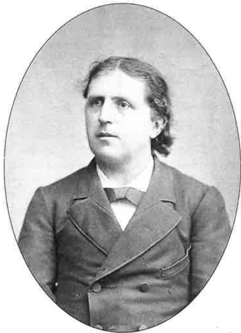
3. Abraham Kuyper (1837-1920).

Geniet in dank wat de Almacht geeft, En tracht Haar niet te dwingen!