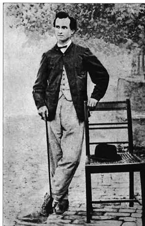
1. Stephanus Jacobus du Toit (1847-1911) als student in Stellenbosch, rond 1870.

De Hollandse volksaard bekoorde hem; hij typeerde de Nederlanders als beleefd, degelijk en arbeidzaam. Du Toit keek op van de 'bijna overmatige zindelijkheid' die hier heerste, zeker in vergelijking met Egypte, Palestina, Turkije, Bulgarije, Roemenië en Italië: 'Hoe heerlijk is het om door de schoone straten van eenige Hollandsche stad te wandelen nadat ik zoolang door die enge, vuile, stinkende stegen en gangen der Oostersche steden moest wandelen. Des te schooner waren die nette huizen nadat ik zoolang de liederlijke woningen in