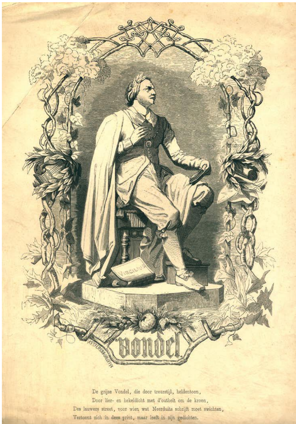
Afb. 1 Negentiende-eeuwse Vondelverheerlijking. Particuliere collectie.