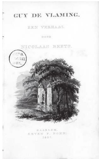
Afb. 4 Nicolaas Beets, omslag Guy de Vlaming . (Haarlem 1837).

Beets zal er niet wakker van hebben gelegen. Hij was in korte tijd in het middelpunt van de belangstelling komen te staan en groeide uit tot een gerespecteerd lid. Op 23 januari 1840 sprak hij zelfstijdens een openbare – enkel aangeregenommeerde sprekers toevertrouwde – vergadering, toen hij in Leiden zijn Ada van Holland