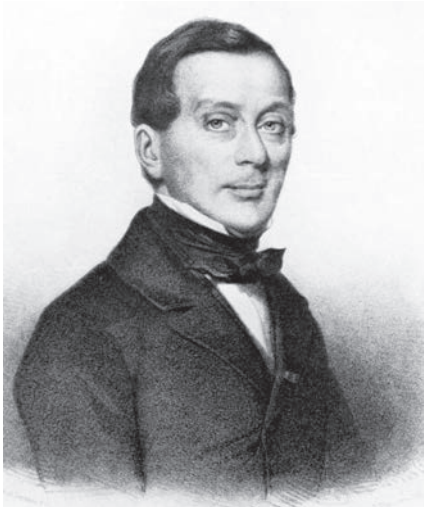
Afb. 2 Portret van Jacob Geel (1789-1862).