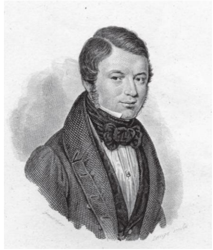
Afb. 3 Grebner/Lange, Portret van Nicolaas Beets als student (1814-1903).