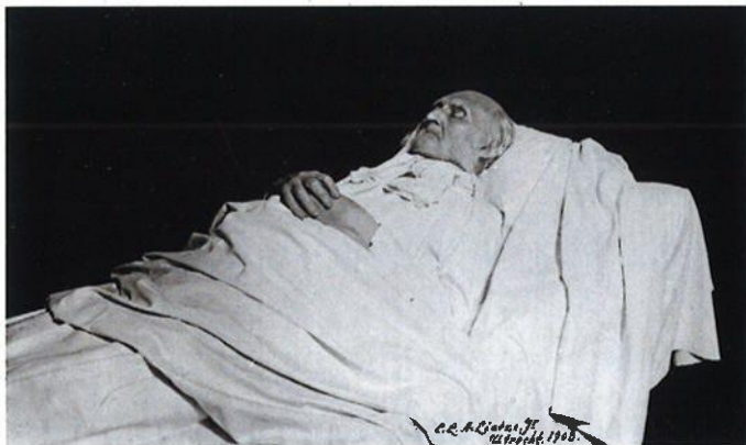
Nicolaas Beets op zijn doodsbed, 1903.

Beets zelf overleed op 13 maart 1903, rond half vijf 's middags, in zijn woning in Utrecht, 88 jaar oud. Zijn dood kwam niet als een verrassing, want sinds het einde van februari – nadat de schrijver getroffen was door een beroerte – hadden veel kranten vrijwel dagelijks over zijn verslechterende toestand bericht.