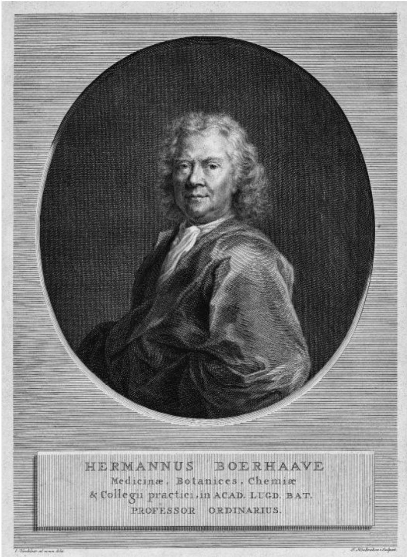
Afbeelding 1: J. Houbraken, J. Wandelaar, Portret van Herman Boerhaave (1668-1738).