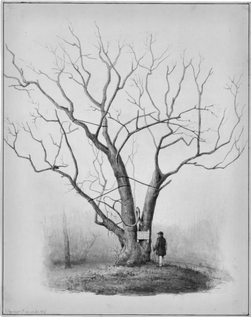
Afbeelding 4: Tekening van de tulpenboom van Boerhaave op Oud-Poelgeest, circa 1857.

behoed zints meer dan dertig jaar' [afb. 4]. 9 In 1855 bleek de trots van weleer een 'ouden wechmolmenden tulpenboom' (Van Zonneveld 1989,