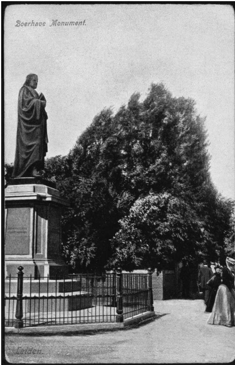
Afbeelding 2: Prentbriefkaart met gezicht op het standbeeld van Boerhaave te Leiden, circa 1900.