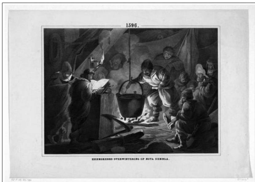
Fig. 11.1 Stampa di metà Ottocento illustrante un episodio dell'epopea olandese a Nova Zembla, che ispirò a Tollens l'epos Come svernarono gli Olandesi a Nova Zembla nell'inverno del 1596-1597 (1819).

In anni recenti, il secondo verso ha fatto gridare alla xenofobia, mentre in realtà si trattava per Tollens soprattutto di un riferimento alla pluriennale dominazione francese da cui i Paesi Bassi si erano appena liberati. Nelle strofe sono la fede, il patriottismo e la fedeltà agli Orange a occupare un posto d'onore, con una preghiera a Dio che nella strofa finale è invocato a protezione del sovrano, del popolo olandese e della patria tutta. Non sorprende quindi che Tollens venga a tutt'oggi presentato come il massimo esponente di quella tradizione letteraria votata alla celebrazione della triade Dio-Patria-Orange.