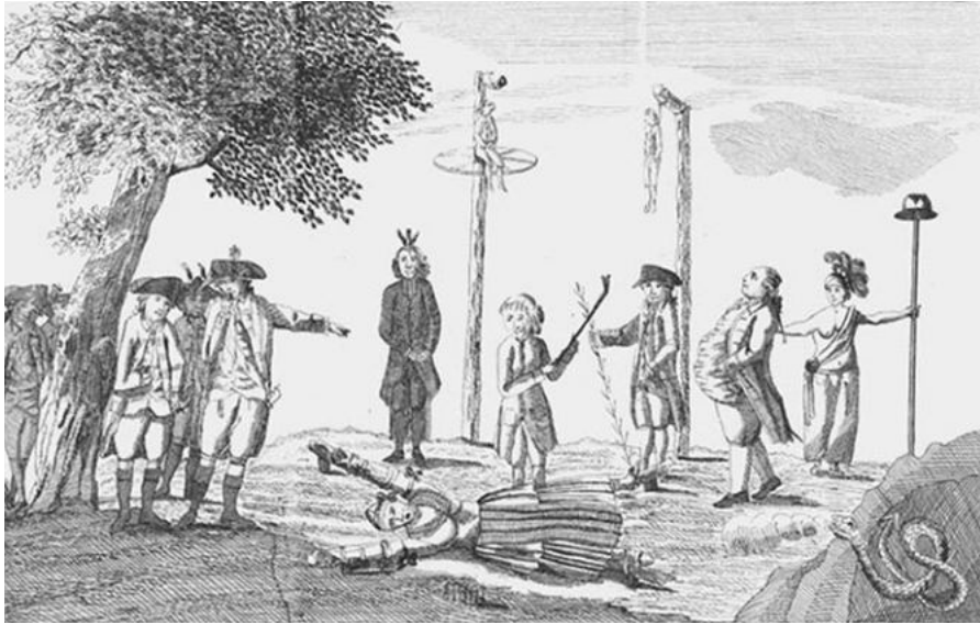
Spotprent op een aantal Oranjeklanten, onder wie Kaat Mossel en bakker Trago.

hoogleraren te beschermen tegen het volksoproer. Ook leden van het exercitiegenootschap moesten het ontgelden: hun huizen werden bestormd, beschadigd en geplunderd. Rond vijf uur in de middag verzamelden de leden van Voor Vrijheid en Vaderland zich om te exerceren buiten de stadpoorten. Omdat de volkswoede vooral tegen het vrijkorps gericht was, begaven de studenten zich naar het exercitieveld om bescherming te bieden. Uiteindelijk kwam het echter niet tot een handgemeen met het Oranjevolk. 18 Volgens de Na-courant , een meer Oranjegezinde bron, stelden sommige patriotten zich nogal provocerend op, en was met name een zekere Adrianus Hartevelt, jeneverstoker en zeer gehaat vrijkorpsofficier, 19 de oorzaak van alle tumult: