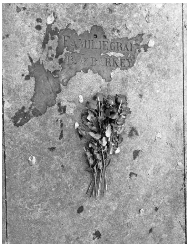
Het graf van de familie Barkey op Oud Eik en Duinen.