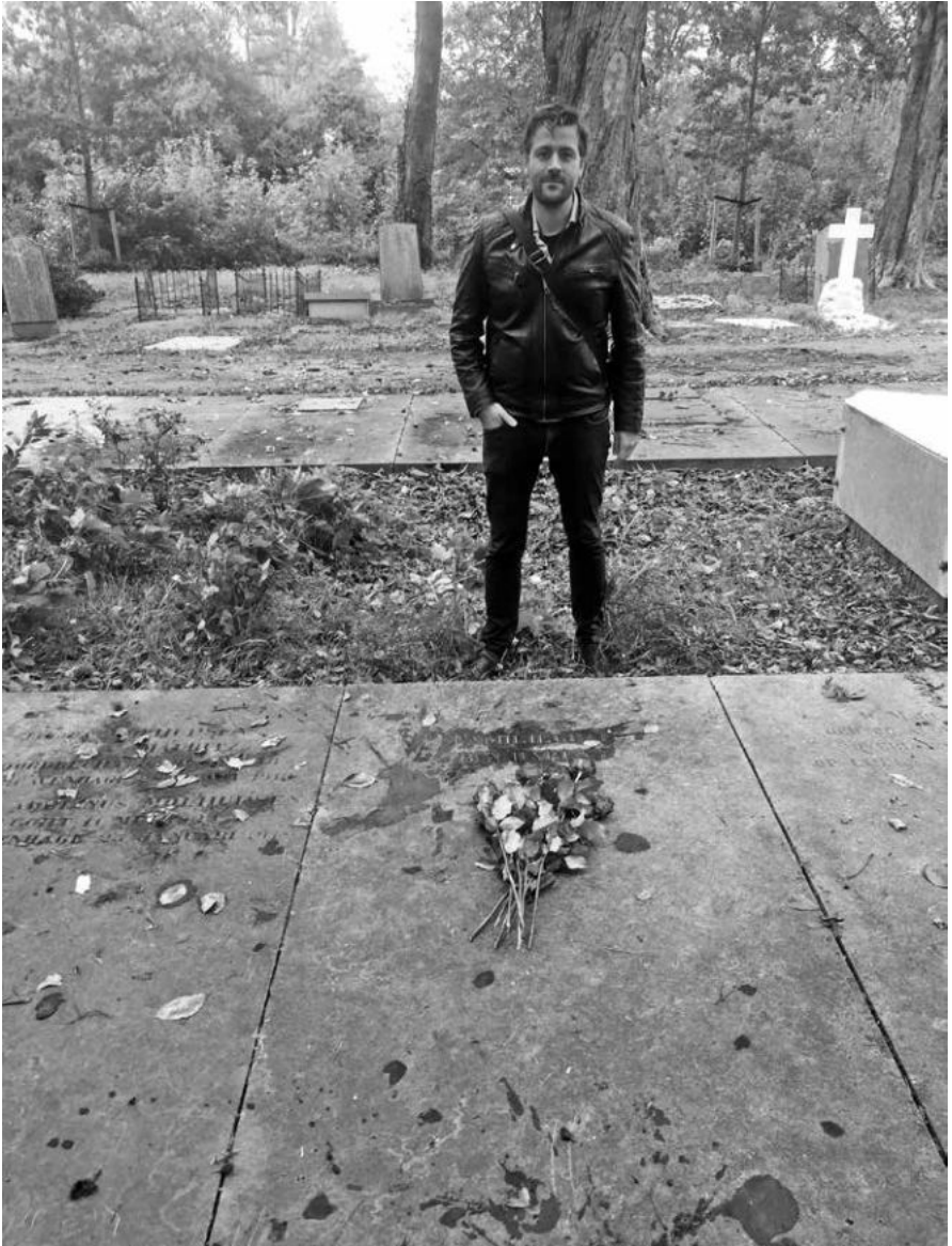
Een van de auteurs bij het graf van de familie Barkey op Oud Eik en Duinen, 4 oktober 2020.