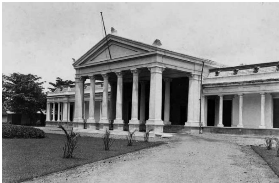
Palais van Justitie te Soerabaja, circa 1900.