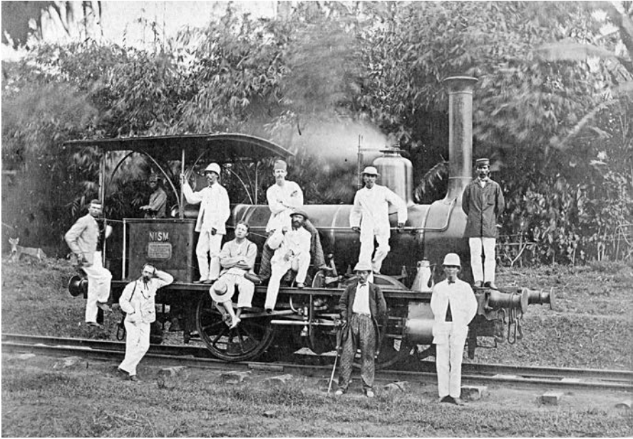
Locomotief met personeel van de Nederlandsch Indische Spoorweg Maatschappij op Java, omstreeks 1880.