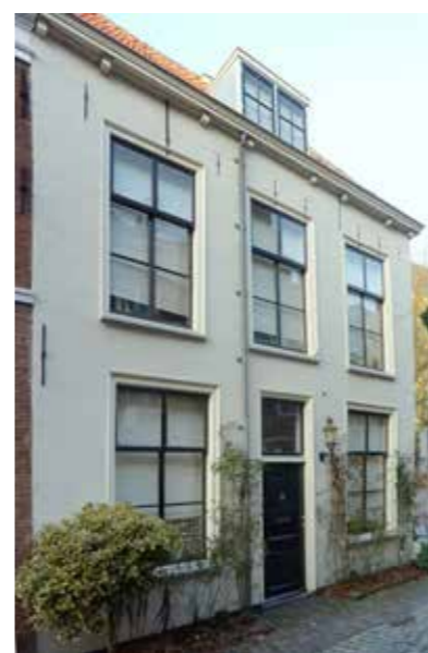
Klooststeeg 14 in Leiden, het pand waar de firma L. Herdingh en Zoon van Vincent Herdingh gevestigd was. Foto door Rudolphous, 3 februari 2010 (gemaakt voor Wikipedia).