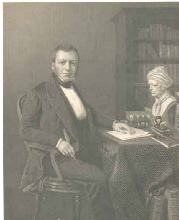
Portret van Isaïc da Costa met buste van Bilderdijk.