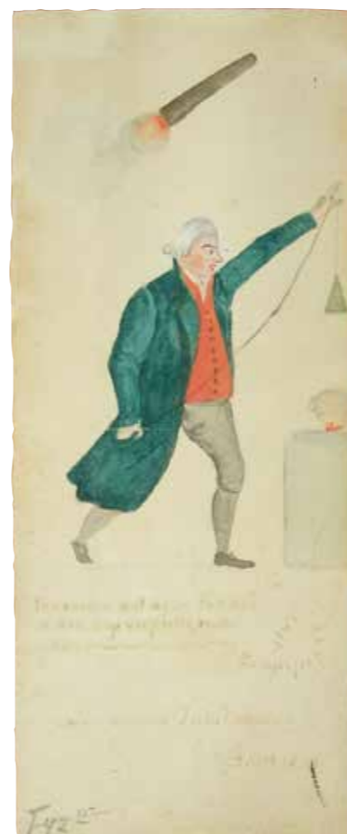
Spotprent op Bilderdijk, die met een domper het vuur der Verlichting tracht te doven. Het onderschrift luidt: 'Ik wenschte dat deze Fakkel u den kop verplette, oude gek. Vive de verlichting, uw vriend Jubelhond. Amsterdam 1820'.