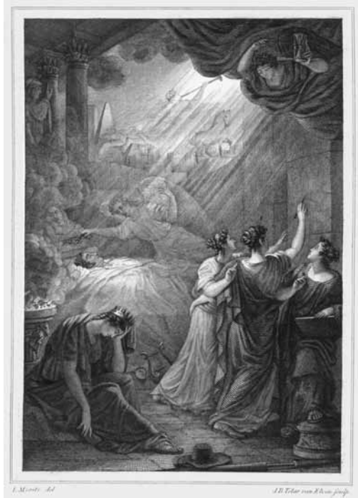
12 Zinnebeeldige prent van Bilderdijk op zijn doodsbed, uit de voor hem na zijn overlijden verschenen Gedenkzuil voor W. Bilderdijk (1833) (collectie UB Leiden).

dwaasheid en onverdraagzaamheid die in Nederland rondwaarde. 76 En in de Arnhemsche Courant schreef men: 'Nauwlijks heeft een der Domperridders door zijne bezwaren tegen den geest der eeuw zijnen naam alom berucht gemaakt, of een tweede Domperridder, tot een ander wapen behorende, betreedt het tooneel.' De criticus toonde zich bezorgd over de 'verstandelijke vermogens' van beide heren, die lid waren geworden van Bilderdijks 'zoo verderfelijke Domperfabriek'. 77 Opnieuw verschenen er tal van boze schriftelijke reacties op Capadoses publicatie. 78