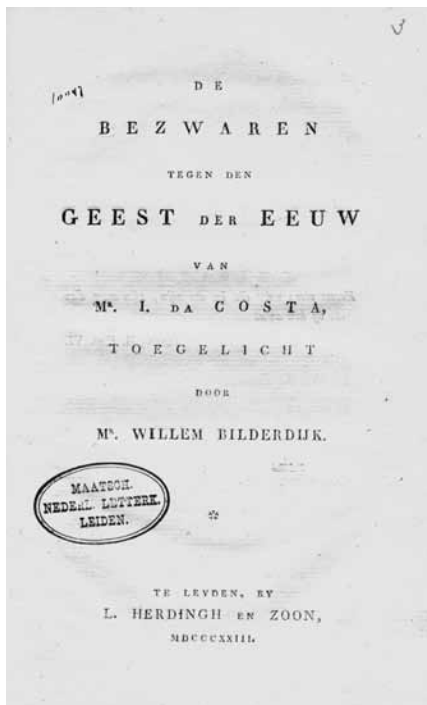
9 W. Bilderdijk, De bezwaren tegen den geest der eeuw van Mr. I. da Costa toegelicht (1823).

Dwangzucht, die zich met de dolk in de hand en godlasterenden vloek in den mond, thands verdraagzaamheid noemt, in het harnas gejaagd, en geschrift by geschrift uit doen stooten.’ Vervolgens onderschreef hij elk bezwaar en deed er dan nog een schepje bovenop. 69