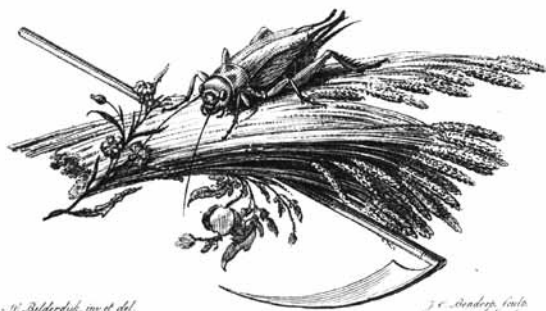
16. Bilderdijs, nu et del.