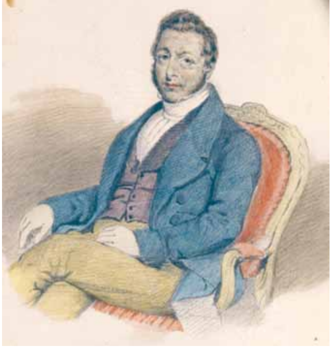
5 Medaillonportret van Isaïc da Costa (collectie Allard Pierson, Amsterdam).