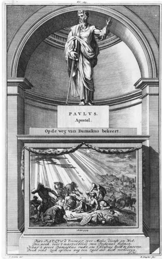
8 De (beking van de) apostel Paulus. Prent uit 1698 (collectie Rijkmuseum, Amsterdam).