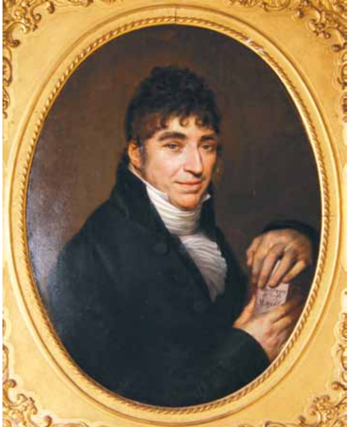
3 Olieverfportret van Willem Bilderdijk, 1815, door M.I. van Bree (collectie Werkgroep Bilderdijk, Leiden).