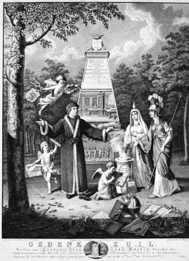
2 Gedenkzuil ter ere van Laurens Janszoon Coster, 1823.

waarin hij de heilzame uitvinding bejubelde, en de Leidse hoogleraar en redenaar Johannes Henricus van der Palm hield in de Bavokerk een lofzang op de boekdrukkunst en op de 'Rede, het goddelijkste, dat in ons is'. 6 Uit Van der Palms voordracht sprak niet alleen de verdraagzame geest van de Verlichting, maar ook de tevredenheid met de eigen tijd. 7