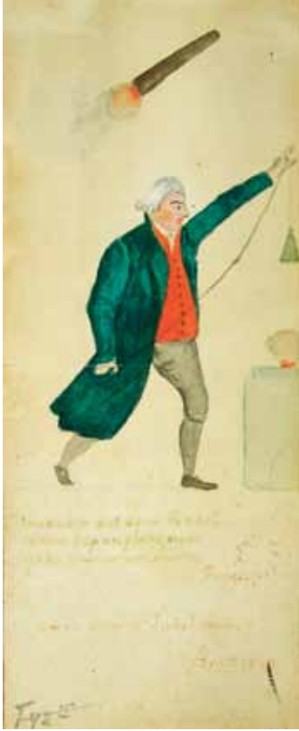
4 Bilderdijk als 'domper'. Spotprent door een onbekende kunstenaar (collectie Werkgroep Bilderdijk, Leiden).

landse geschiedenis en het staatsrecht en verwierf hij een kleine schare volgelingen, onder wie de latere antirevolutionaire politicus Guillaume Groen van Prinsterer en Jacob van Lennep. 13 Die laatste zou Bilderdijk in zijn roman Klaasje Zevenster (1866) typeren als de opiumverslaafde 'professor Onderbroek': 'Dezen naam plachten de studenten aan Bilderdijk te geven, om dat hij, te huis zittende, doorgaans zeker gewoon kledingstuk miste.' 14