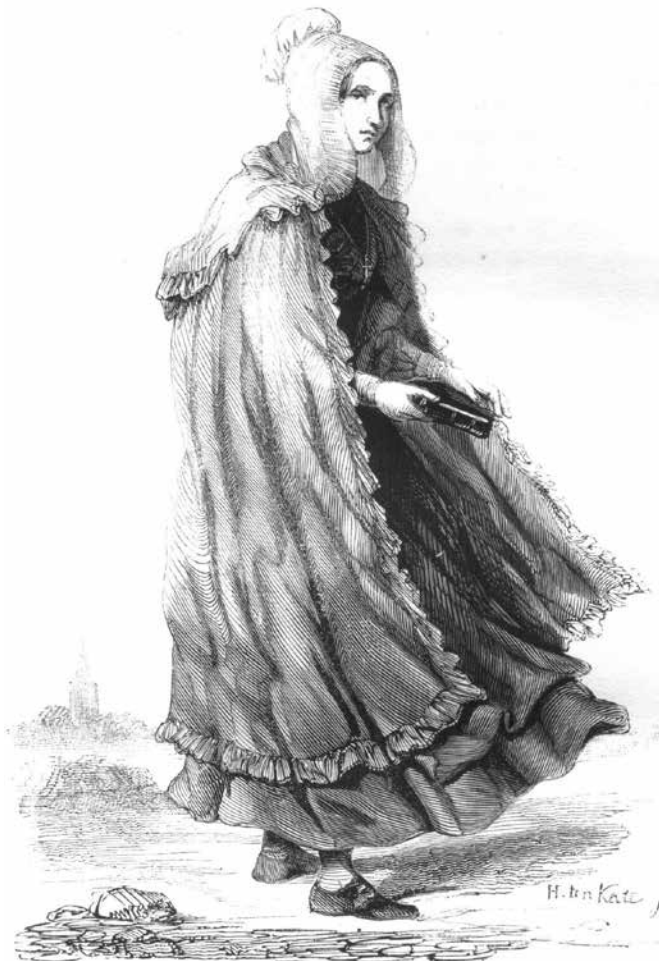
Knipsel naar aanleiding van de brief die Keetje in 1884 aan Beets stuurde. [UBL LTK Beets D 47:5].