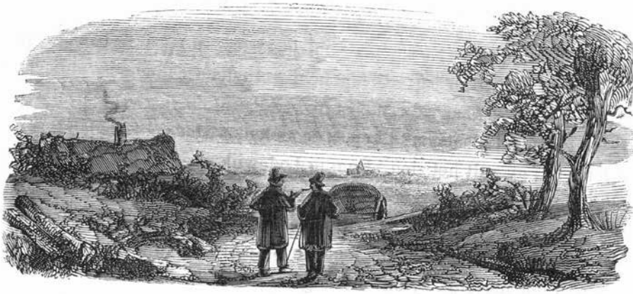
Twee wandelaars op weg naar Oosterhout, afbeelding bij Hildebrands verhaal in De Nederlanden . Karakterschetsen, kleederdragten, houding en voorkomen van verschillende standen (1841). Leiden, Universitaire Bibliotheken (UBL), [1154 B 13].

had. Wat toen gebeurde, zou Beets nooit vergeten: 'Zij zag op, en haar groot blauw oog maakte zulk een indruk op den jongste der beide reizigers, dat hij oogenblikkelijk het getal harer aanbidders vergrootte.' In het verhaal maakt de voormalige Leidse Jager, die tegen zijn vriend heeft opgeschept over de speciale band die hij met Keetje had, zich bekend, maar zij verwacht hem met een ander.